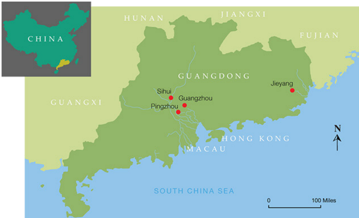
广州、揭阳、四会和平洲是中国广东的四大翡翠加工交易中心。

中国的翡翠行业是在清朝末年兴起的，那时候是慈禧太后当政的时期（1861-1908年）。从那时候起广州就逐渐形成了翡翠雕刻的中心，从事玉雕的很多人都是四会人。上世纪八十年代中国改革开放之后，很多玉雕匠人返回四会创业，与此同时也将这项技能传给下一代人，并以此带动当地的玉石行业的繁荣发展。四会的翡翠行业在2005年之后才飞速发展起来，现在每年的交易额已经达到千亿级。