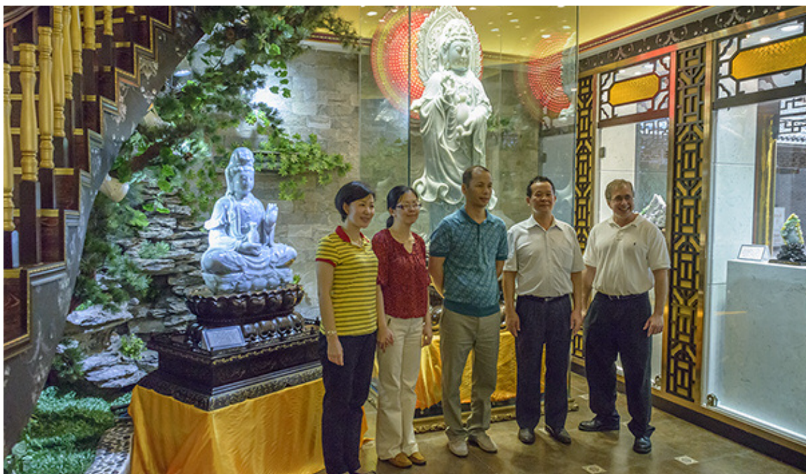
广东的玉石行业专家热情的接待了美国宝石学院一行人并和我们分享了自己在这个行业里工作的心得。

虽然西方人一直不是很了解，但中国的玉石行业和市场一直在蓬勃地发展和壮大。虽然这个市场也经常经历起伏，但就长期发展来看还一直保持着稳步提升的状态。这个特殊的行业有着自己的行业术语，评价标准，复杂性及专业性。这个行业与彩色宝石行业不同，它有自己的专属市场，华人则是市场的主要消费者，这主要源于华人在骨子里和玉石的不解之缘，在华人世界，没有一种宝石可以在文化上和玉石相比。