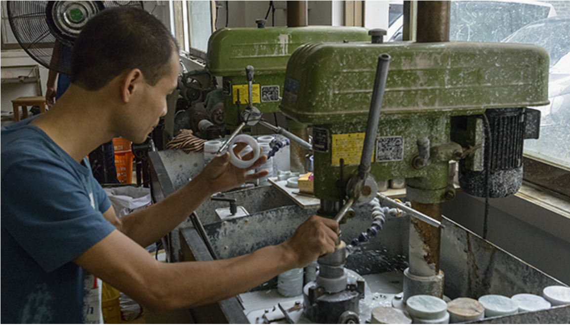
平洲以加工翡翠手镯而闻名。工人用旋转钻头切出手镯的轮廓。

里最大的交易中心之一叫“翠宝苑”。这个交易中心旨在将当地的翡翠业和旅游业结合在一起。交易中心的投资商来自云南，这也是为什么这些建筑都具有浓郁的云南特色，看起来就像身处云南的大理。在交易中心里还有一个专门开辟的区域用于展示玉雕大师的代表作品。