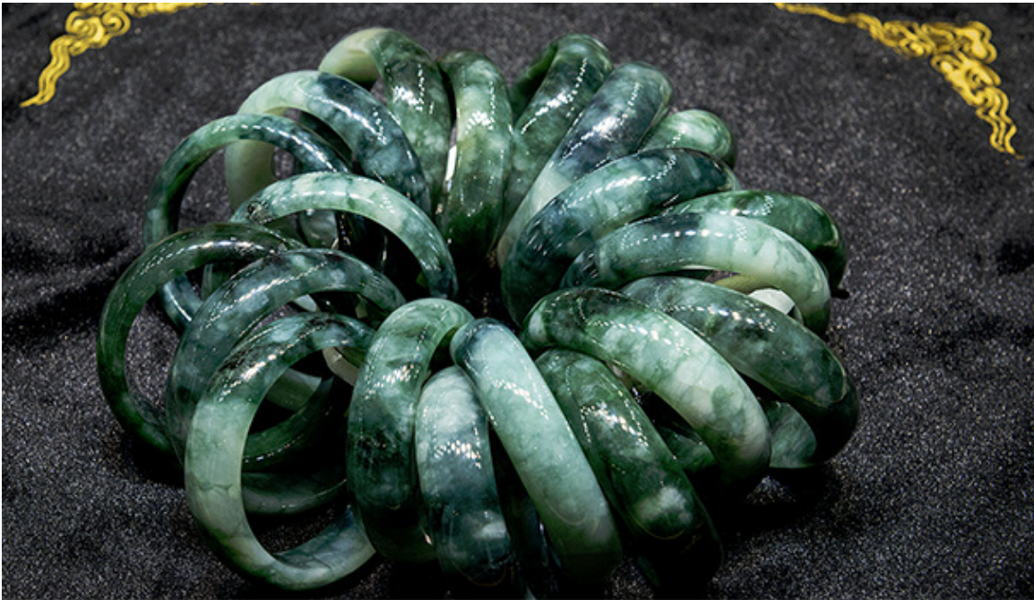
在平洲，您可以看到各种各样的翡翠手镯。这其中就包括这种带巧色的。场景由妈祖玉器提供。