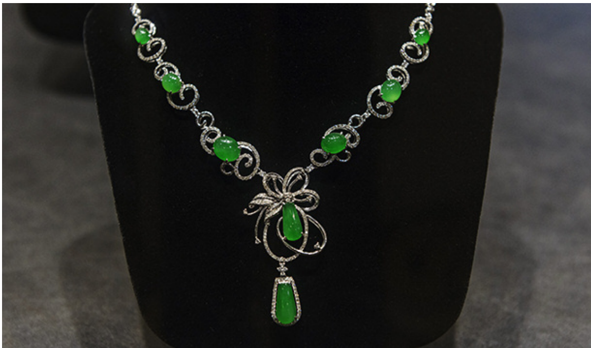
四会的一些高端零售店销售“帝王玉”翡翠饰品。照片由美国宝石学院Eric Welch拍摄。场景由汉武玉庭提供。

中国的翡翠行业是在清朝末年兴起的，那时候是慈禧太后当政的时期（1861-1908年）。从那时候起广州就逐渐形成了翡翠雕刻的中心，从事玉雕的很多人都是四会人。上世纪八十年代中国改革开放之后，很多玉雕匠人返回四会创业，与此同时也将这项技能传给下一代人，并以此带动当地的玉石行业的繁荣发展。四会的翡翠行业在2005年之后才飞速发展起来，现在每年的交易额已经达到千亿级。