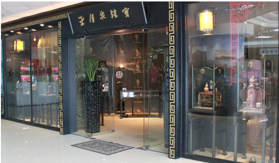
图6. 这是王月要珠宝在北京的旗舰店的外景。