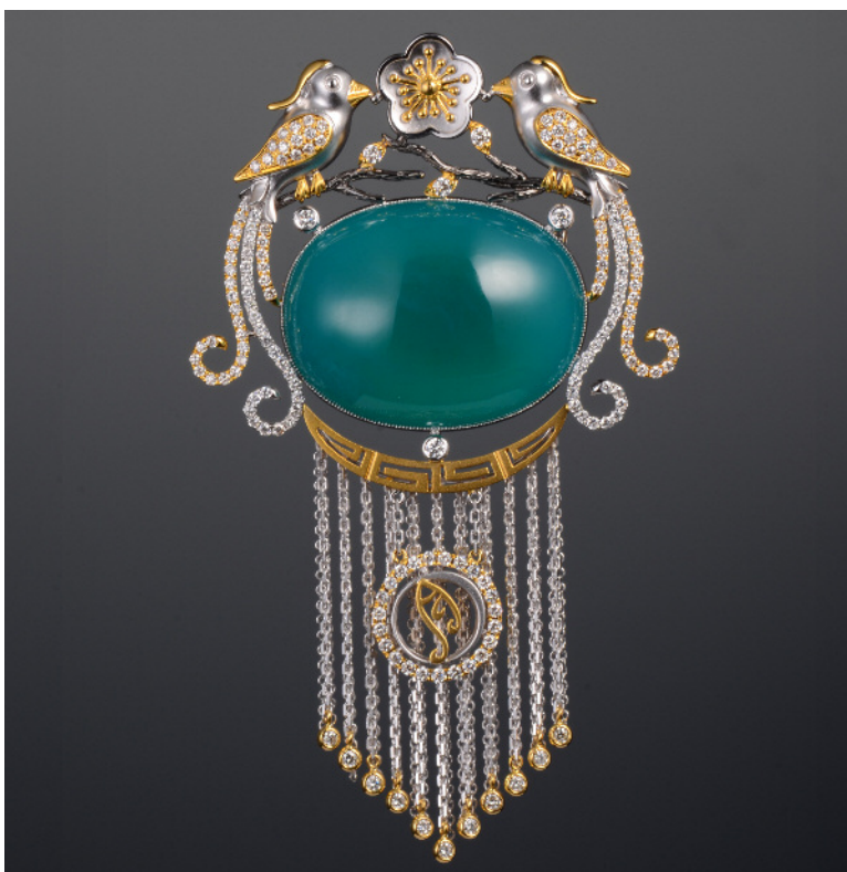
图7.喜鹊、花草、流苏和汉字都是王月要的珠宝中经常使用的元素。