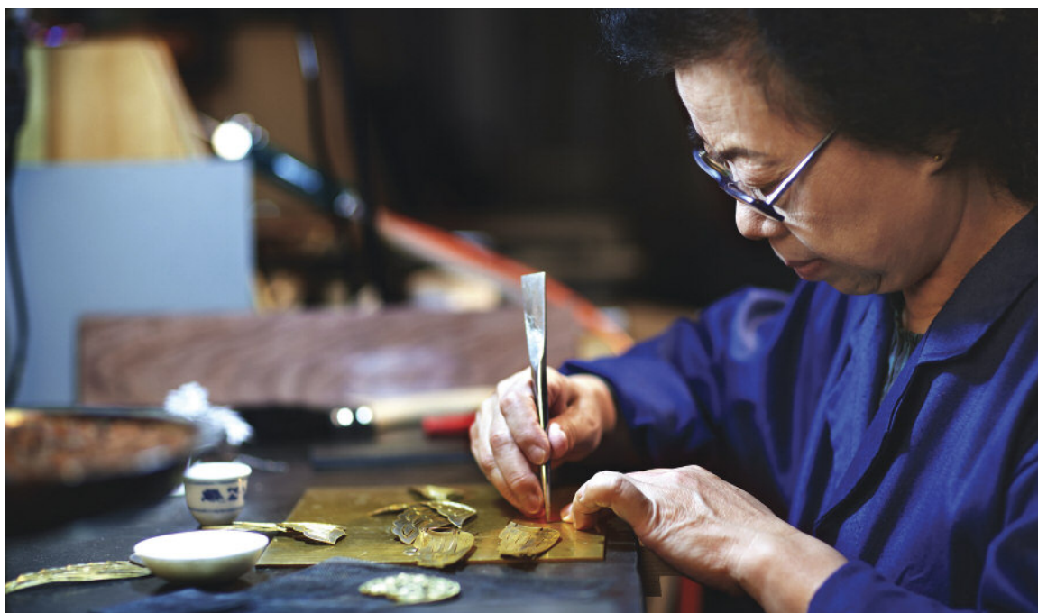
图8. 白大师仍然在工作室全职工作，而且还倾心教授新的学徒。