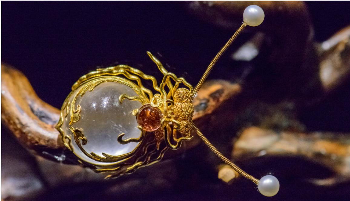
图1. 这件花丝镶嵌的胸针在昆虫的头部运用了很复杂的花丝技巧，然后工匠运用镶嵌技艺将透明的翡翠嵌进昆虫的身体部分。

花丝镶嵌工艺也被称为“细金工艺”。顾名思义，这项工艺主要由两种技艺组成（图1）。首先是花丝工艺，这包括了将掐、填、焊、堆垒、攒和编织等基本手工技巧应用于不同粗细的金银细丝。另一项工艺是镶嵌工艺，这包括将各种不同的技法应用于金属片上，将其做成各种形式的托座，再把各种宝石嵌在其中。手工艺人在创作中可以随意选用其需要的各种技巧加以应用来完成一件作品。