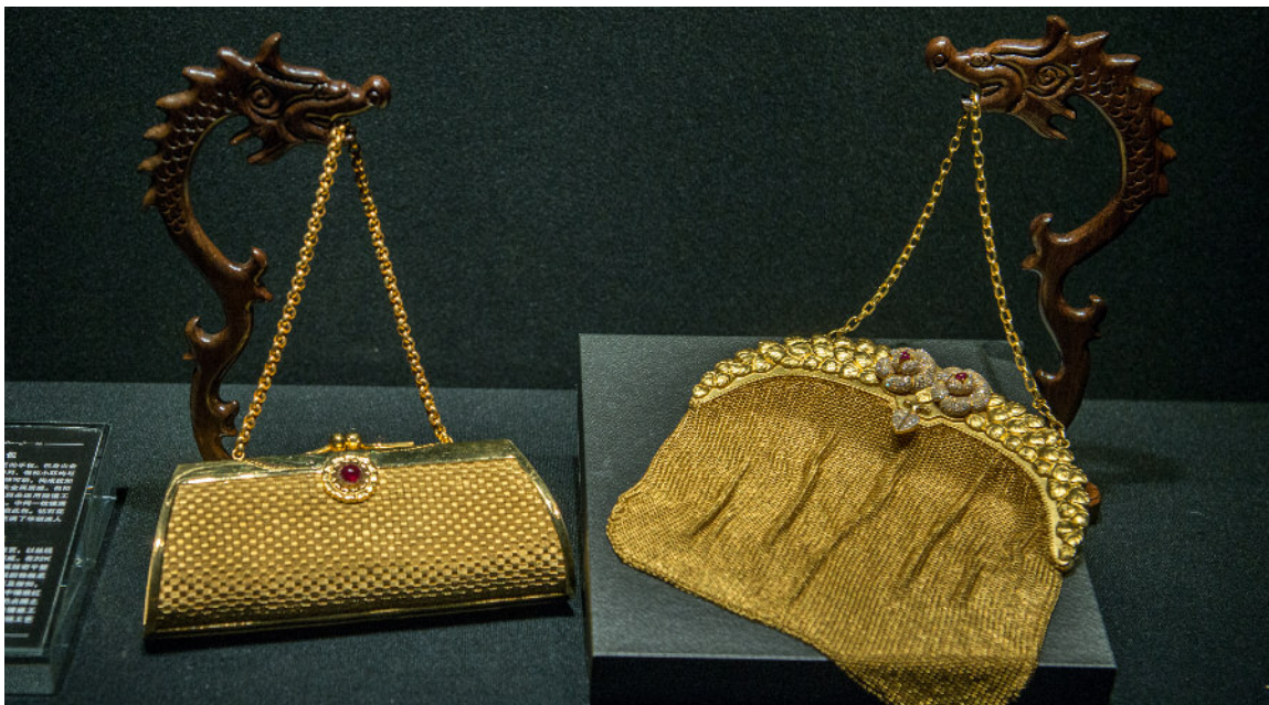
图9. 这些自主设计的现代花丝镶嵌手工艺品也展示于昭仪新天地的博物馆中。