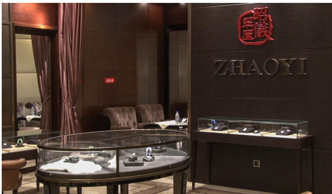
图4. 昭仪翠屋是知名的高端翡翠品牌。白大师与昭仪合作了一个传承花丝镶嵌工艺的工作室。昭仪用翡翠业务赚来的利润来支持对这项古老技艺的传承。

昭仪翠屋是知名的高端翡翠品牌，致力于高端翡翠业务和对花丝镶嵌工艺的传承。白大师欣然接受了和昭仪的合作。四年前，由昭仪出资帮白大师成立了花丝镶嵌工艺工作室。昭仪同时也支持白大师的想法，即先花一些时间通过复制历史精品来重新打磨完善老的工艺技巧，之后再开发自己设计的花丝新产品（图5）。