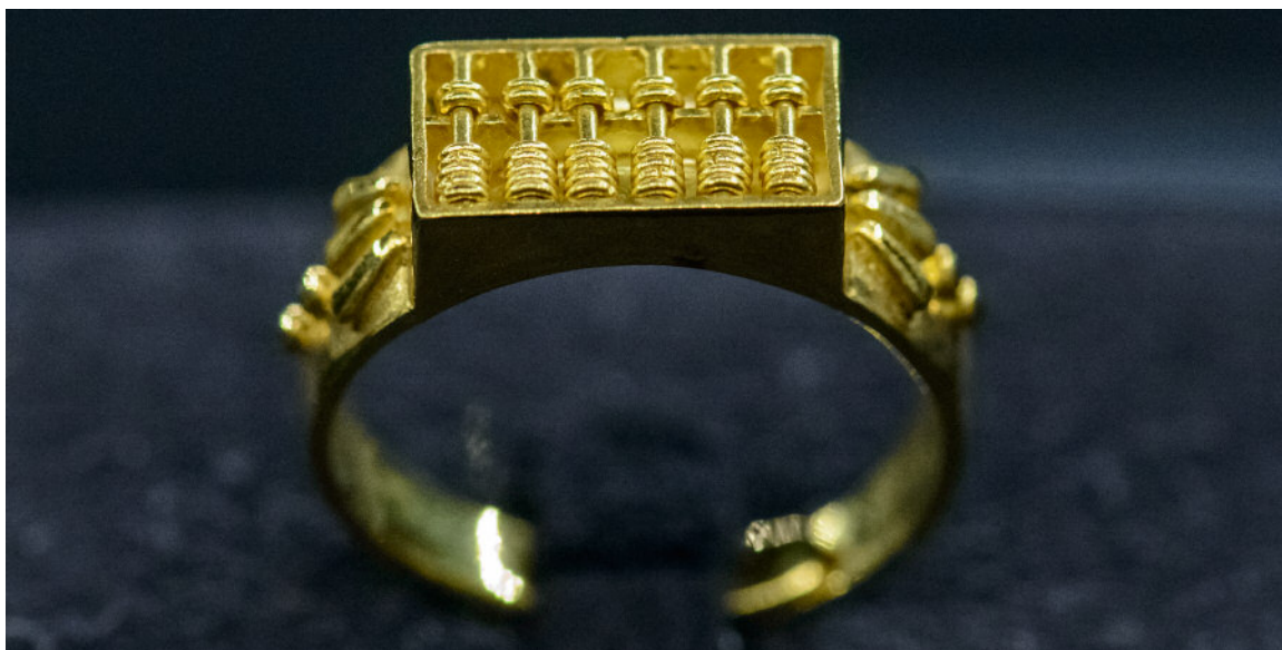
图3. 这枚花丝戒指是清朝作品的复制品。原作品是婆婆送给新婚儿媳的礼物。算盘代表精打细算，婆婆希望自己的儿媳能够让家庭的未来更加兴旺。算盘上的每一个算珠都可以自由移动。