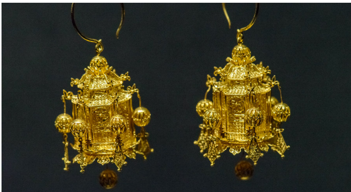
图2. 这对耳环是仿造明朝六角宫灯制作。宫灯耳坠形状似小亭，六角伸出挑梁，六角及底部坠有绣球。随着佩戴者的走动，绣球随之而动，颤若铃铛，妙不胜收。

清朝末年，中国社会经历了前所未有的大动荡，没落的清皇室再没有能力负担这些奢侈品的制作和享用。很多宫廷艺人出走并开始自己的手工艺生意。在一段时期内，北京的南城曾经聚集了很多小型的制作花丝镶嵌工艺的作坊。北京的南城自古就是各种手艺人聚集的区域。