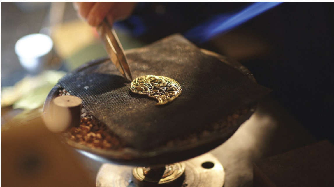
图5. 白大师在花丝镶嵌工艺室工作，她正在制作一件花丝镶嵌作品。